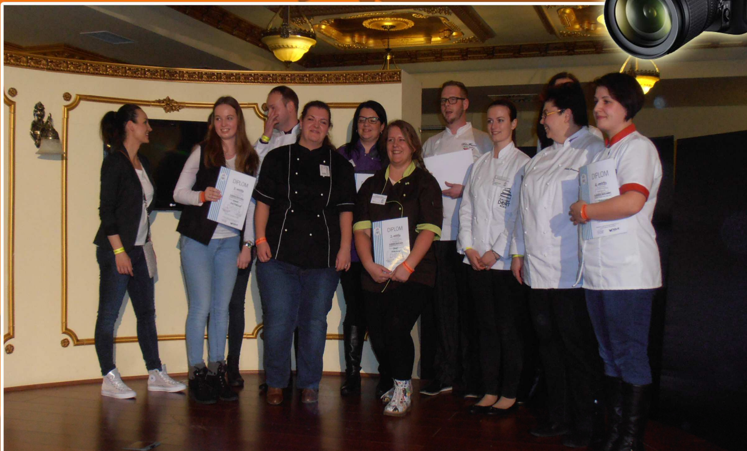
Žákyně 3. ročníku oboru Cukrář na soutěži Svatební dort 2017, která se konala v brněnském Boby centru.