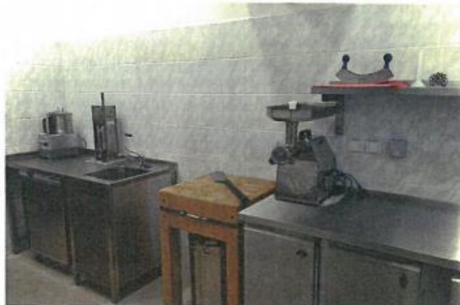
Obr. č. 6: Centrum odborného vzdělávání v Chlumci nad Cidlinou disponuje zrekonstruovanými prostory novým vybavením pro praktickou výuku

Za produktivní práci mají žáci možnost získat 2 000 až 5 000 Kč za 10 dnů, navíc mají možnost vykonávat u smluvních partnerů brigády. Žáci oboru Řezník-uzenář se pravidelně zúčastňují soutěží, kde mají možnost předvést získané dovednosti. V minulém roce získal žák SŠTŘ Nový Bydžov Pavel Vítek třetí místo v bourání masa na Přehlídce odborných dovedností oboru Řezník-uzenář ve Valašském Meziříčí, následoval úspěch žáků Pavla Vítka a Milana Galáda na soutěži „Řeznická sekera“ v Poličce, kde vybojovali 2. místo v bourání pepřové půlky a v poznávání surovin pro výrobu a stejní žáci přivezli také 3. místo z „Mezinárodní sůfaže mäsiarov“ z Rimavskej Soboty.