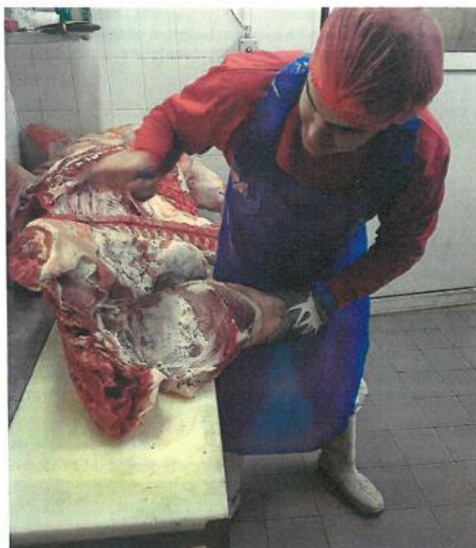
Obr. č. 2: Získávání praktických dovedností při bourání jatečně upravených těl

V současné době škola nabízí široké spektrum učebních a studijních oborů. Mezi čtyřleté technické studijní obory zakončené maturitní zkouškou patří Technik silniční dopravy a Operátor silniční dopravy, tříleté technické učební obory zakončené výučním listem zahrnují Opravář zemědělské techniky, Řidič nákladní a osobní dopravy, Diagnostik motorových vozidel, Elektrikář – silnoproud a Automechanik. Dále škola nabízí tříleté potravinářské učební obory zakončené výučním listem (Řezník-uzenář, Kuchař-číšník, Cukrář) a možnost nástavbového studia ve dvouletých studijních oborech zakončeného maturitní zkouškou (Dopravní a letecká technika, Operátor zemědělské techniky, Dopravní technika, Technologie potravin).