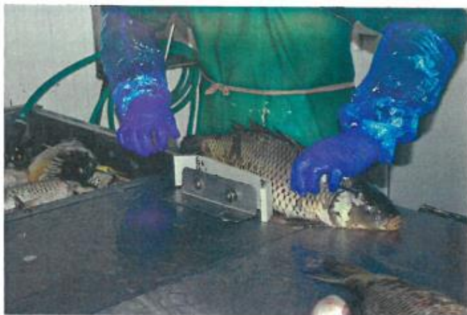
Obr. č. 4: Otevírání tělní dutiny ryb naparovacím nožem

s.r.o., Skaličan a.s. Česká Skalice nebo v provozu Játka Bareš v Lužici nad Cidlinou.