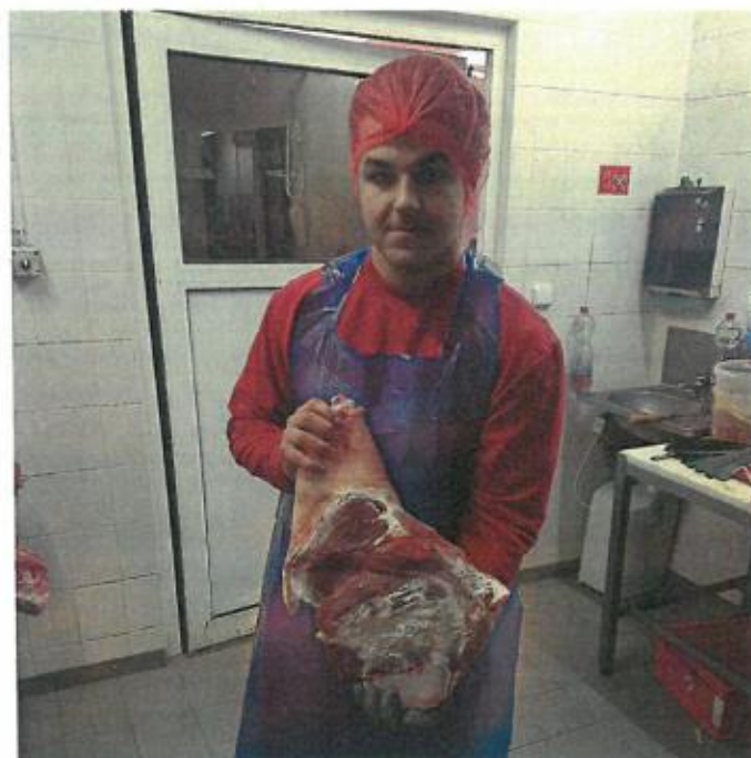
Obr. č. 3: Správné dělení a třídění masa patří k základům řeznického řemesla

Obor Řezník-uzenář má na škole dlouholetou tradici a je zde vyučován od sedmdesátých let minulého století. V současné době navštěvuje tento obor celkem 19 žáků, z toho je 7 v prvním ročníku, 8 ve druhém ročníku a 4 ve třetím ročníku. Obor Řezník-uzenář navštěvují také dvě dívky. Výuka se skládá z teoretického vyučování a z odborného výcviku. Teoretická výuka probíhá v Novém Bydžově a rovněž v Chlumci nad Cidlinou, odborný výcvik probíhá ve Středisku praktického vyučování v Chlumci nad Cidlinou, které bylo vybudováno s finanční podporou Královéhradeckého kraje a bylo dokončeno v září 2019. Jsou zde nové prostory pro teoretické i praktické vyučování vybavené nezbytným zařízením pro odborný výcvik nejen řezníků, ale také kuchařů a cukrářů. Další odborný výcvik probíhá u smluvních partnerů a na smluvních pracovištích. Budoucí řezníci se zdokonalují v porážení jatečných zvířat a zpracování jatečně upravených těl např. v provozech masokombinátu TORO Hlavečnick, MASO Jičín