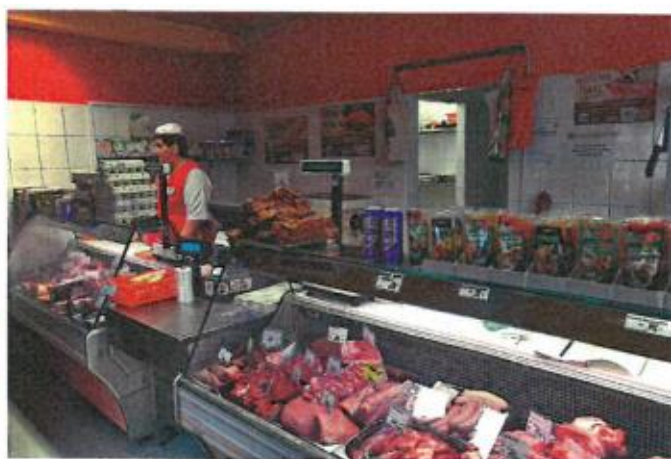
Obr. č. 7: Řeznická prodejna v areálu Centra odborného vzdělávání Chlumeck nad Cidlinou

Střední škola technická a řemeslná ve spolupráci se smluvním partnerem školy, společností Maso Jičín, provozuje v areálu vlastní řeznickou prodejnu. Zde se žáci nižších ročníků oboru Řezník-uzenář seznamují s obchodními činnostmi v prodeji masa a uzenin. Prodejna nabízí široký výběr výsekového masa a uzenin z vlastní výroby. Jako důkaz vysoké úrovně školy udělil Český svaz zpracovatelů masa 1. října 2019 Certifikát pro Střední školu technickou a řemeslnou Nový